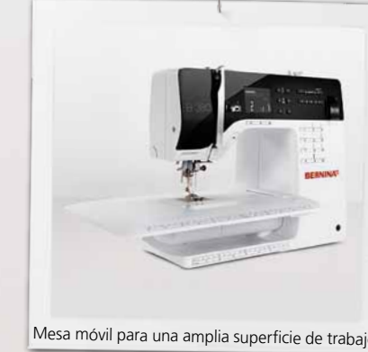
Mesa móvil para una amplia superficie de trabajo